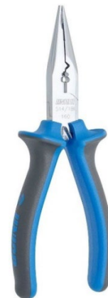
Klešče elektr. 514/1B

Primer lupilca kablov je zgolj kot funkcionalni primer lupljenja, z raztegovanjem ali z zarezovanjem in vlekom. Pri testni ploščici je pomembno, da je bela (ne prozorna ali rumena!) in da stranske povezovalne linije za napajanje (+ in – linije) niso prekinjene.